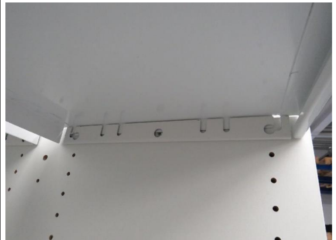
Abb./Pic. 4: Bodenträger Stahl / shelf support steel