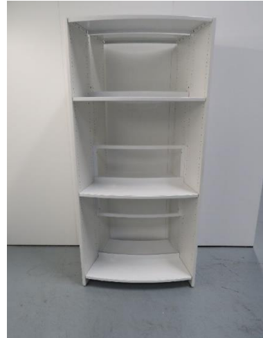
Abb./Pic. 2: Rückansicht 26° / rear view 26°