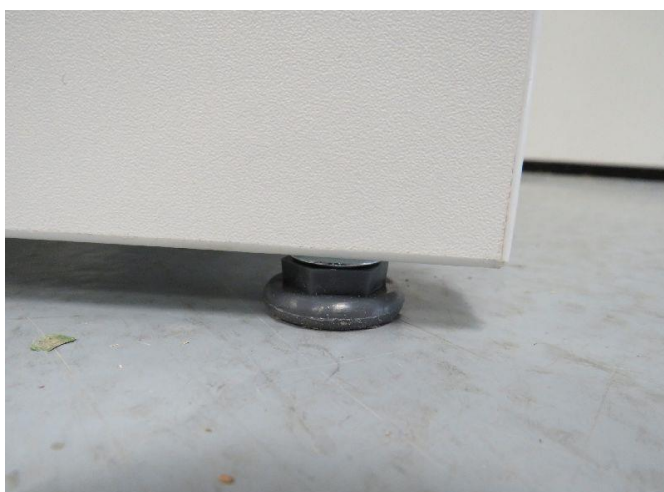
Abb./Pic. 5: Fuß / foot