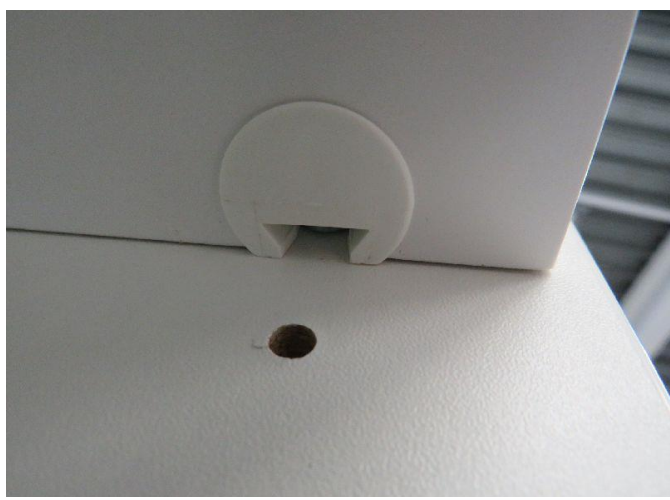
Abb./Pic. 3: Bodenträger Holz / Wooden shelf support