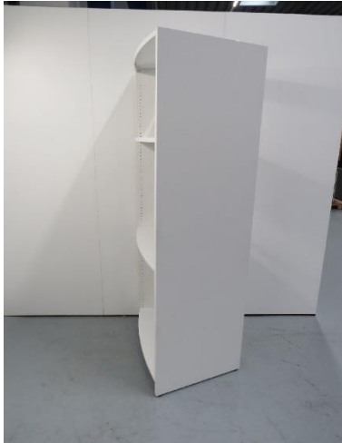
Abb./Pic. 1: Seitenansicht 26° / side view 26°