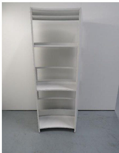
Abb./Pic. 3: Bodenträger Holz / Wooden shelf support