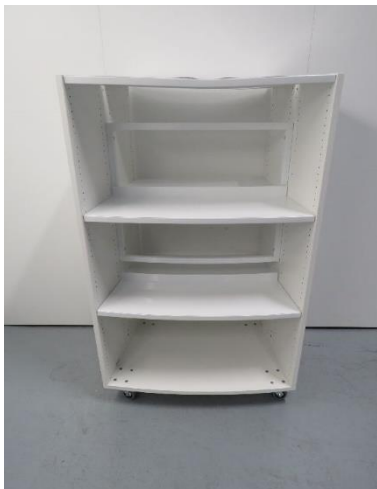
Abb./Pic. 3: Rückansicht 18° / rear view 18°